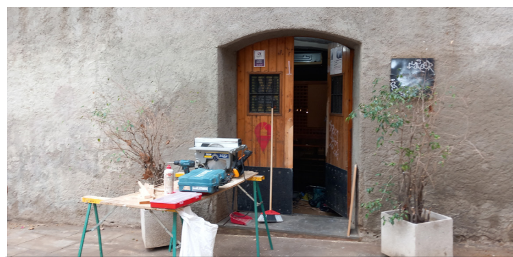
Can Trilla, aquest dijous amb el manyà arranjant la porta malmesa.

La masia de Can Trilla, objecte de negociació entre la propietat de l'Arquebisbat de Barcelona i l'interès de l'Ajuntament per abordar la possible ubicació d'un equipament municipal, ha rebut aquest dimarts la primera visita de tècnics i responsables de les dues parts per avaluar presencialment l'estat de l'espai, abandonat ara ja fa dos anys