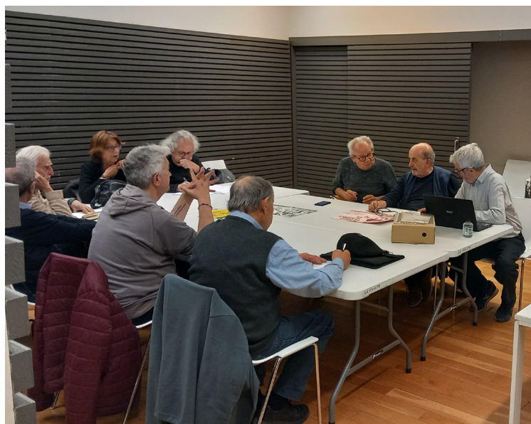
Els veterans de l'AV Vila de Gràcia, en una reunió recent.